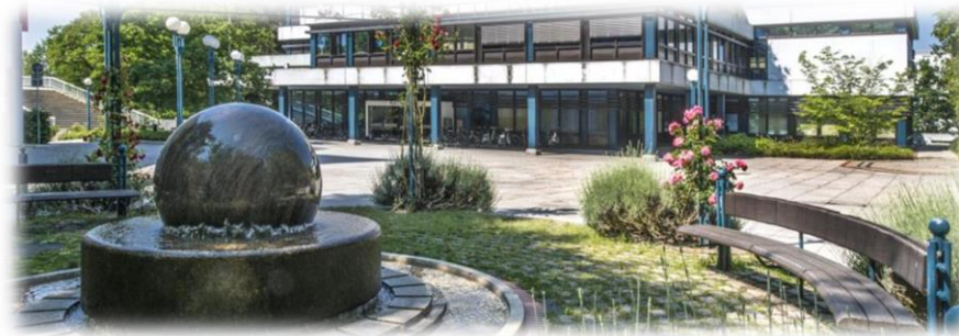
Stadt Wörth am Rhein